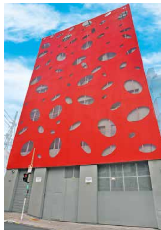
Nova Sede: Rua Humaitá, 483 – Bela Vista

Praça da Sé, 371 – Centro – São Paulo/SP Atendimento Odontológico Gratuito, Fisioterapeuta / RPG, Crédito Consignado, Psicólogo.