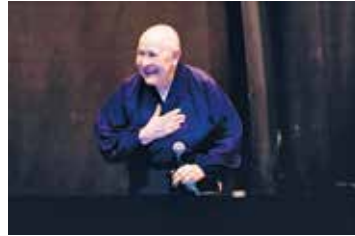
Monja Coen Roshi