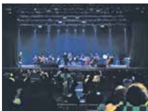
Orquestra Filarmônica de Campos do Jordão e Região